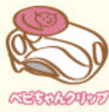
ベビちゃんクリップ

A メルシーポットだけの「ベビちゃんクリップ」を使えば、しつこいネバネバの鼻水もスッキリ吸引することができます。