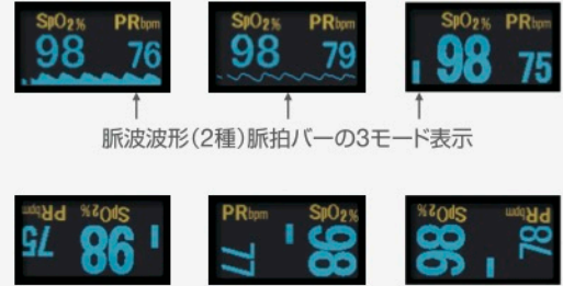
脈波波形(2種)脈拍バーの3モード表示